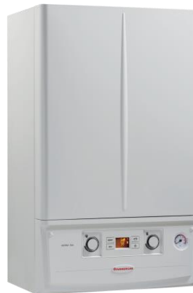
VICTRIX E X A

Kaldaja Victrix TT ErP kanë elektronikë të evoluar që mundëson ndërrimin e gazit (Metan apo GLN) drejtpërdrejt në skedën elektronike , pa patur nevojë për zëvendësim sprucatorë !! Valvulë gazi elektronike, range të lartë modulimi: 10÷100%. Me rendimente të lartë në prodhimin e ujit sanitar falë rregullatorit prurje uji me komandim elektronik. Deri 16 lt/min me \Delta t 30°C.