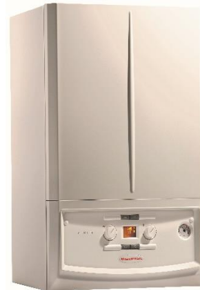
VICTRIX T T