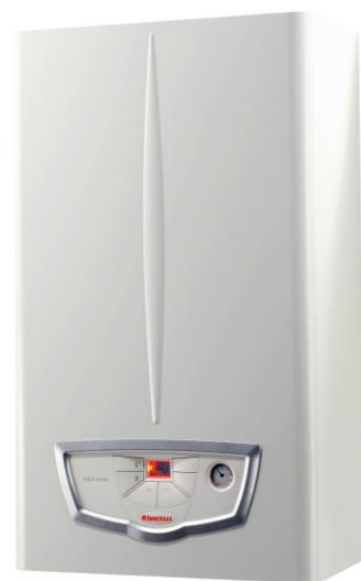
Kaldaja EOLO STAR 24 3 E

Kaldaia vetëm për ngrohje, mund të çiftohen me një bolitor për të prodhuar ujë sanitar. Për këtë qëllim disponohet një kit të posaçëm, me motor dhe konektor, për të mtorizuar valvulen 3 vie ( që kanë kaldajat), dhe rakorderi hidraulike.